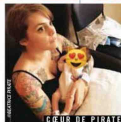
CŒUR DE PIRATE